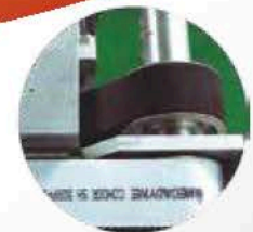
Mesa de succión